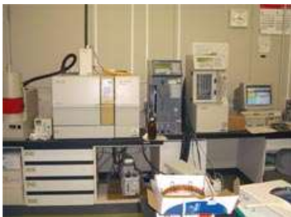
ガスクロマトグラフ質量分析計 トリハロメタンなどの有機化合物を検査します。