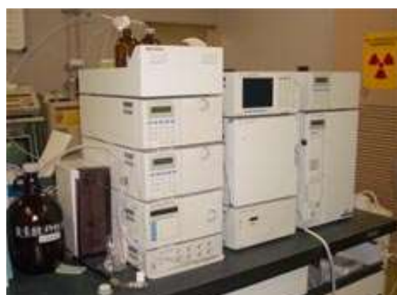
イオンクロマトグラフ（ポストカラム式） シアン、臭素などを検査します。