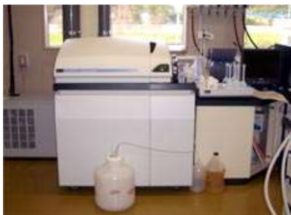
誘導結合プラズマ質量分析計 カドミウムや鉛などの金属類を検査します。