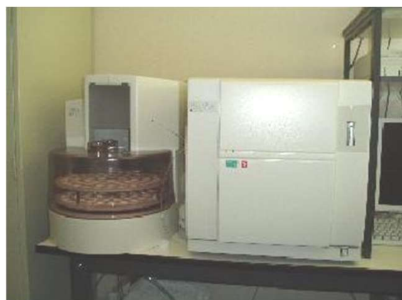
全有機炭素計 有機物等を検査します。