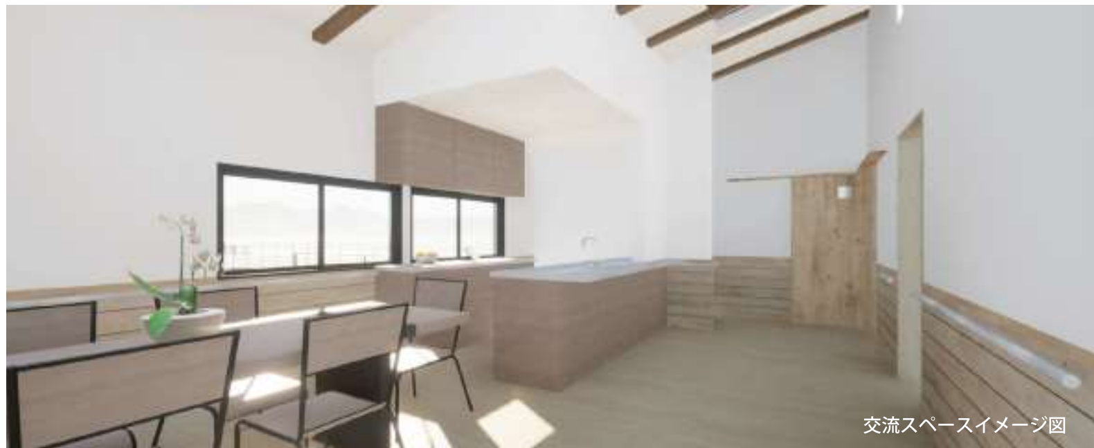
交流スペースイメージ図