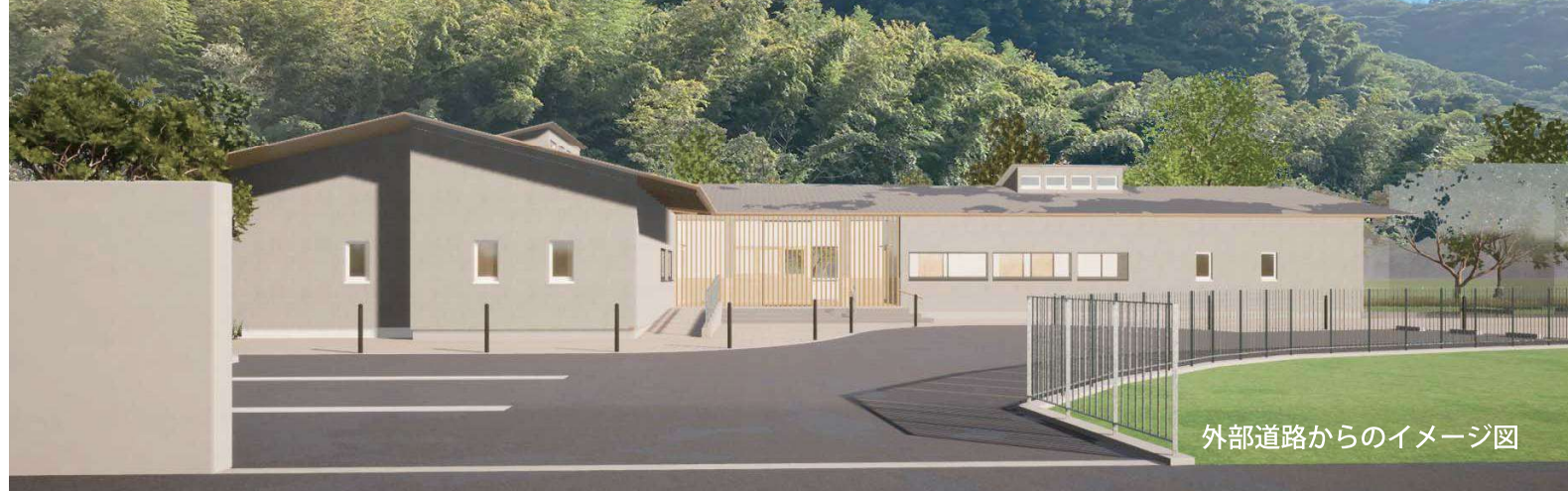
外部道路からのイメージ図

一人ひとりに寄り添い、心通じあう穏やかな場所で笑顔とぬくもりに包まれた暮らしを提供します。