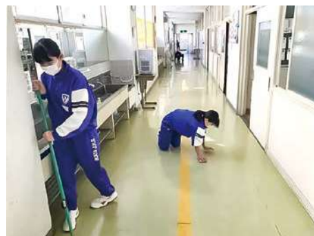
<伊方中生徒の清掃風景>