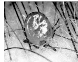
キチマダニ(吸血中) 国立感染症研究所