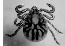
キチマダニ(吸血前) 愛媛県立衛生環境研究所