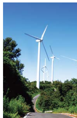
みさき風の丘パーク