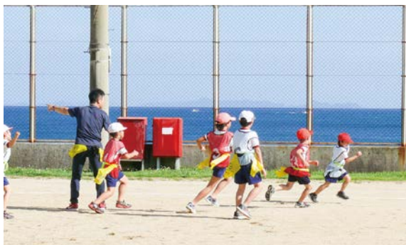
上_三机小学校 (6月24日) 下_大久小学校 (7月1日)

子どもたちに、日本や外国の文化、スポーツを楽しく体験してもらおうと、三机小学校と大久小学校で放課後学童クラブを開校しました。