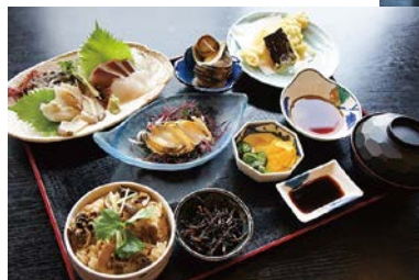
あわびとさざえの贅沢御膳