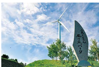
二見くるりん風の丘パーク