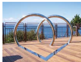
(写真右上) 御籠島展望所 (写真左下) 椿山展望台