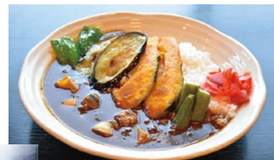
夏野菜とサザエの特製カレー