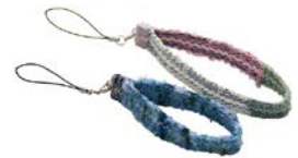
裂き織りストラップ