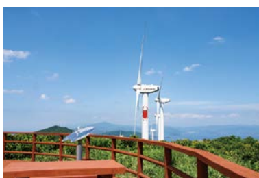
瀬戸風の丘パーク