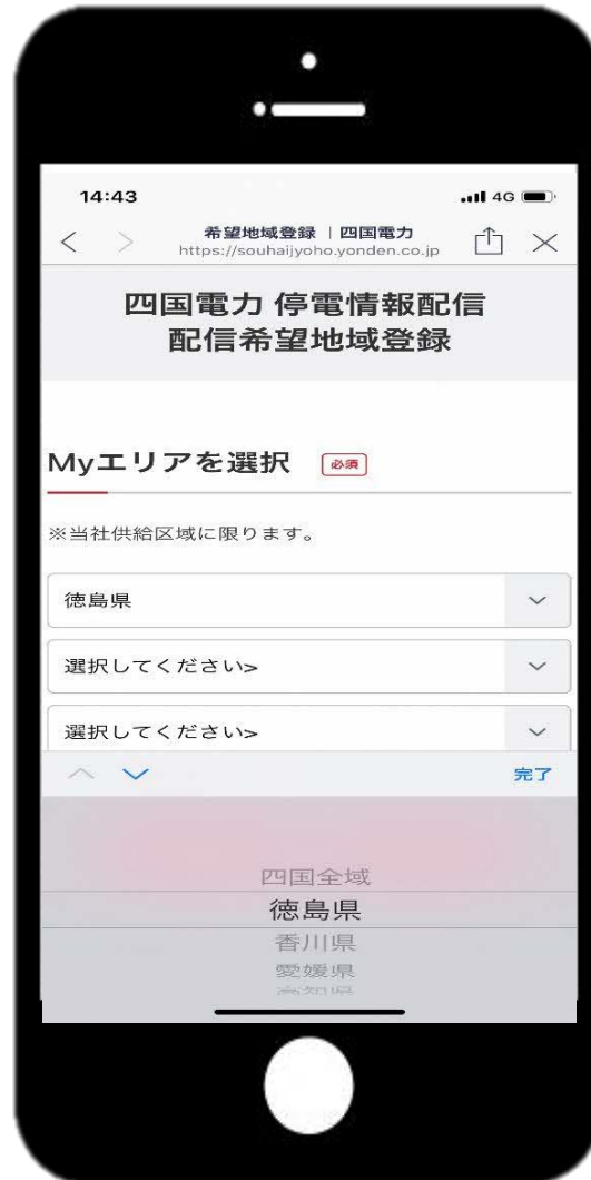
②四国全域または県を選択