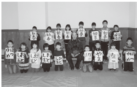
三崎会場(1月7日 三崎支所)の様子