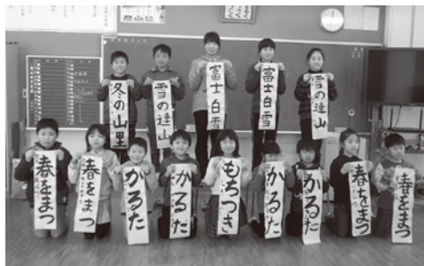
瀬戸会場(1月7日 三机小)の様子

新しい年を迎え、一年の事始めとして字が上手になるように、また今年一年が良い年になることを願い、各公民館ごとに児童(希望者)を対象とした「書初め教室・大会」を開催いたしました。筆を構えた子どもたちの表情は真剣で、納得のいく作品に仕上がるまで何度も練習を繰り返していました。講師の先生方の丁寧なご指導のおかげで、素晴らしい作品が出来上がりました。