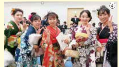
【写真 ①～③ 式典で自己紹介と抱負を発表、④ 式典終了後に、⑤～⑦ 楽しく賑わった茶話会】