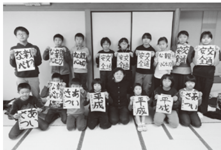
伊方会場(1月5日 中央公民館)の様子