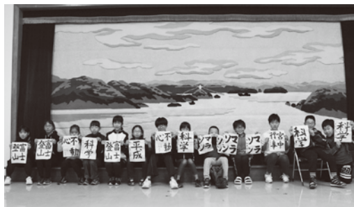
伊方会場(1月4日 町見公民館)の様子

また、伊方会場(中央公民館)では、食生活改善推進協議会のご協力で、七草粥が振る舞われました。この作品は、各公民館ロビー等にて掲示しておりますのでぜひご覧ください。