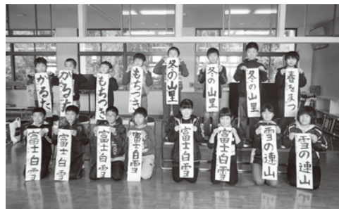
瀬戸会場(1月7日 大久小)の様子