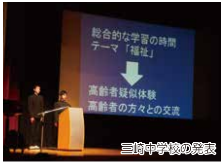
三崎中学校の発表

次に、各中学校による人権学習の発表では三崎中学校が『ありがとうの花』と題して、地域の高齢者との交流、瀬戸中学校が『人権ソング「翔く輝く空へ」の発表』と題して、日常生活の中で工夫した活動の発表や人権ソングの合唱、そ