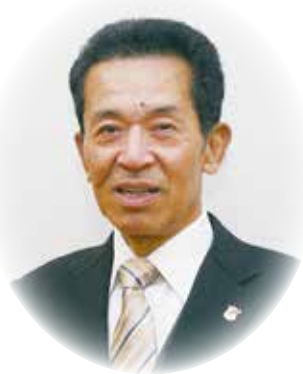
伊方町教育委員会 教育長