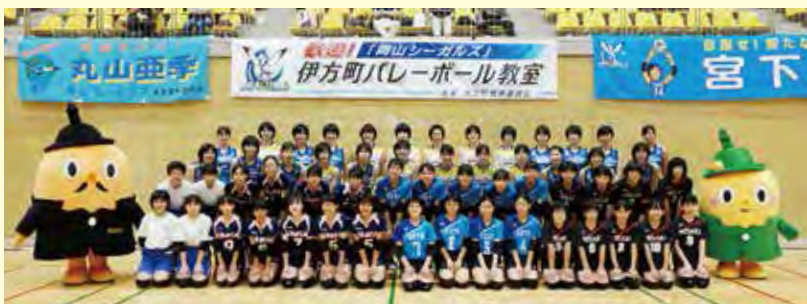
岡山シーガルズと町内中学校の女子バレーボール部の皆さん

8月17日(金)、18日(土)に岡山シーガルズをお迎えし、第10回伊方町バレーボール教室を開催しました。 ※詳細は2ページ