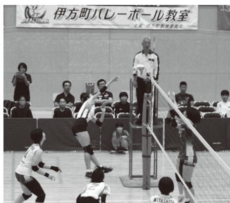
紅白戦で活躍する中学生

2日目は、紅白戦が行われ、3セットのうち、最初の1セット目はシーガルズの皆さんによる紅白戦、2セット目から生徒の皆さんも参加して試合が行われました。