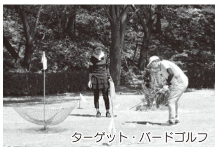
ターゲット・バードゴルフ