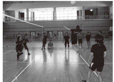
熱戦のレクバレー