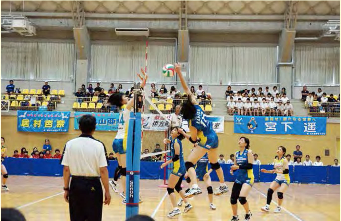
岡山シーガルズによる紅白戦