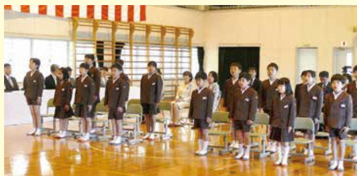
水ヶ浦小学校入学式