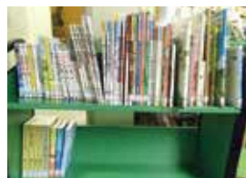
平成29年度共同募金受配図書

伊方町共同募金委員会より、児童用図書資料70点を寄贈していただきました。今回いただいた資料は、地域や家庭での読み聞かせや読書の時間、学校の調べ学習など、子どもの読書活動に幅広く活用されます。