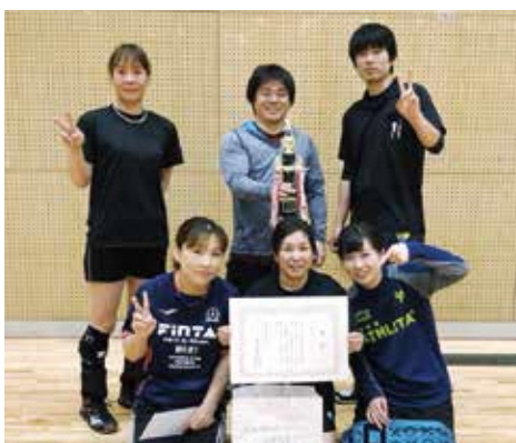
【優勝チーム アンボンタン】

3月25日（日）、伊方町スポーツセンターにおいて、第12回伊方町レクバレーシオンバレーボール交流大会が開催されました。 この大会は、レクバレー愛好会の交流と親睦を深めることを目的に始まった大会です。 当日は、町内をはじめ八幡浜市が