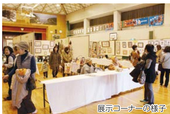
展示コーナーの様子

今年で34回目を迎える二見公民館まつりが、2月18日(日)に二見地区体育館で開催されました。作品展示コーナーでは、保育園児と保護者の作品、小中学生の絵画や書道、各団体の手芸、俳句、絵手紙等が展示され、亀ヶ池生活研究協議会によるお寿司や八幡浜漁協町見青年部によるしらすかき揚げうどん等の販売も行い、訪れた人から大変好評を得ていました。午後からの「芸能発表のつどい」では、ダンス、