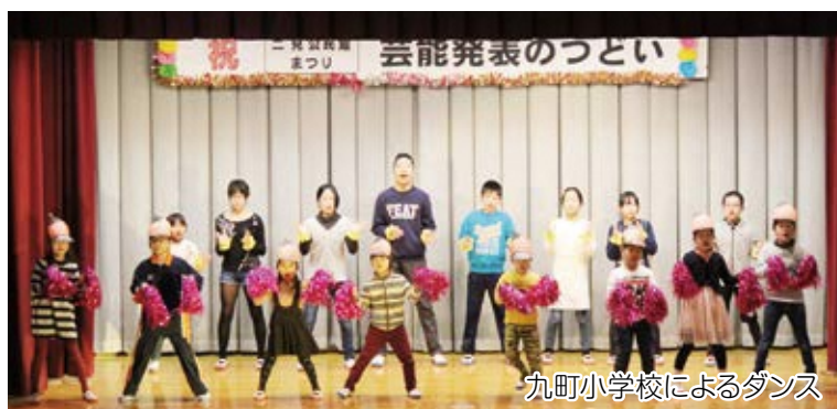
九町小学校によるダンス

今年で34回目を迎える二見公民館まつりが、2月18日(日)に二見地区体育館で開催されました。作品展示コーナーでは、保育園児と保護者の作品、小中学生の絵画や書道、各団体の手芸、俳句、絵手紙等が展示され、亀ヶ池生活研究協議会によるお寿司や八幡浜漁協町見青年部によるしらすかき揚げうどん等の販売も行い、訪れた人から大変好評を得ていました。午後からの「芸能発表のつどい」では、ダンス、