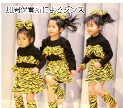
加周保育所によるダンス

箏曲、歌謡等が披露されました。当日は天気も良く、大勢の方にお越しいただき会場は大変盛り上がりしました。出店、即売、出演者及び開催にあたりご協力いただきました皆さまに感謝いたします。ありがとうございました。