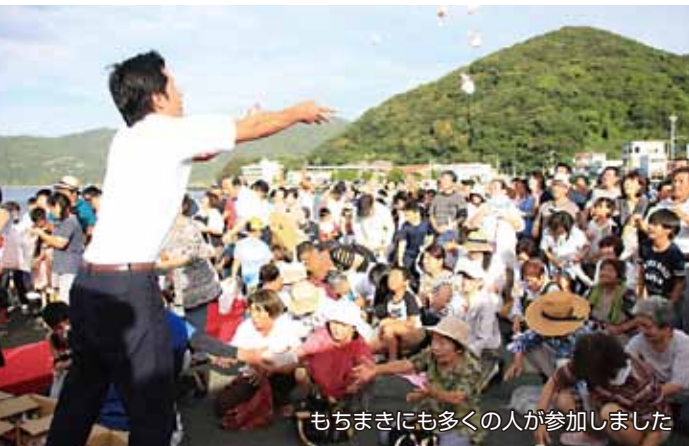
もちまきにも多くの人々が参加しました

8月12日(日)、第33回瀬戸の花嫁まつりを開催しました。昨年は台風接近のため中止となりましたが、今年は天気にも恵まれ、無事開催できました。