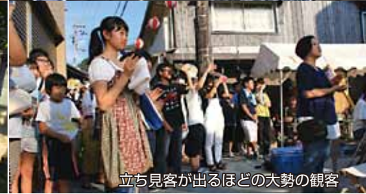
立ち見客が出るほどの大勢の観客

いました。そのライブも平成21年で終わり、新たなイベントを地元二名津で行うことを考えました。