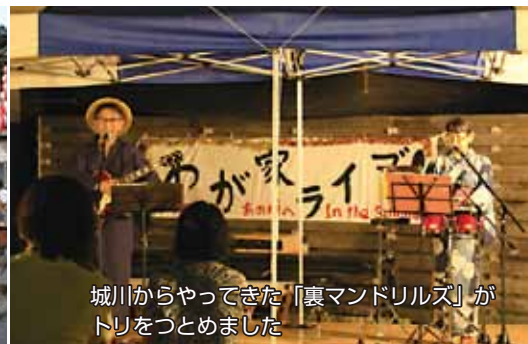
城川からやってきた「裏マンドリルズ」がトリをつとめました