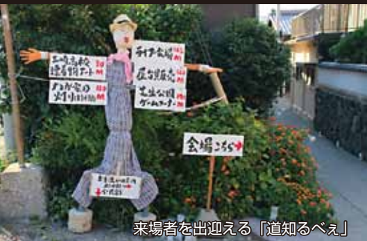
来場者を出迎える「道知るべえ」