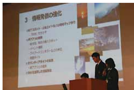
前回のせんたんミーティングの様子