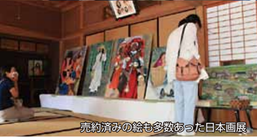
売約済みの絵も多数あった日本画展