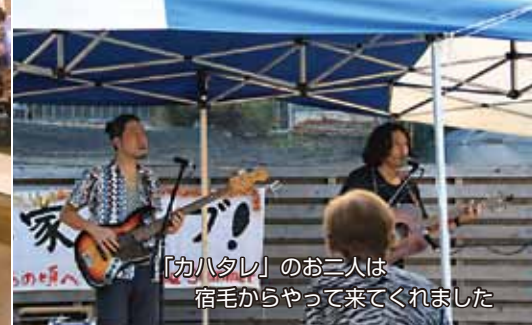
「カハダシ」のお二人は宿毛からやって来てくれました