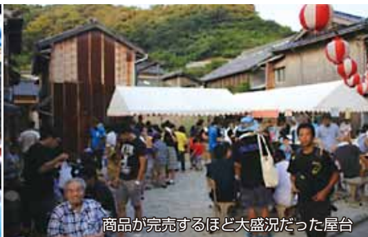
商品が完売するほど大盛況だった屋台