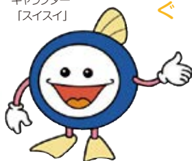
下水道マスコット キャラクター 「スイスイ」