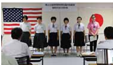
壮行会・結団式の様子

訪れた学生たちは、浴衣の着付けなどの文化体験や町内施設の見学を通じ、日本文化や伊方町への理解を深めました。この体験は、一緒に参加した伊方町の中学生にとっても新鮮なことで、自分たちの故郷を知る機会になったようです。また、10日間のホームステイでホストファミリーたちとの友好も深まり、帰国の際には別れを惜しむ姿が印象的でした。