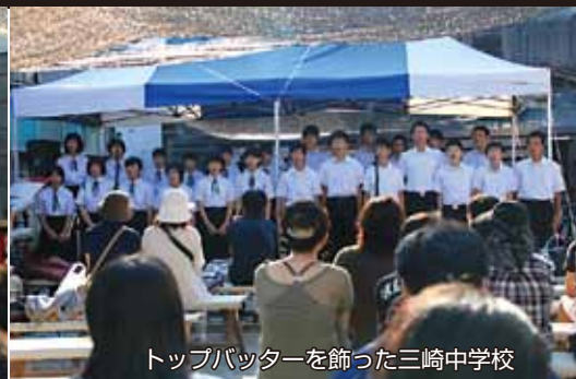
トップバッターを飾った三崎中学校