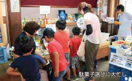
駄菓子選びに大忙し