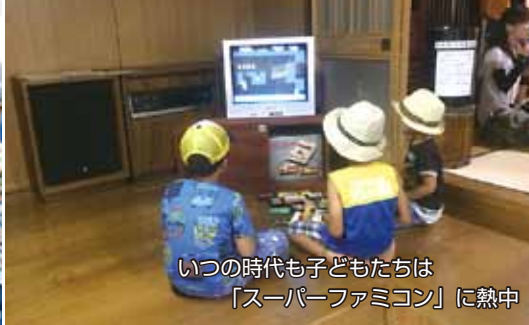
いつの時代も子どもたちは「スーパーファミコン」に熱中