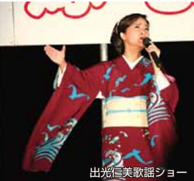
出光仁美歌謡ショー