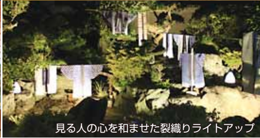
見る人の心を和ませた裂織りライトアップ