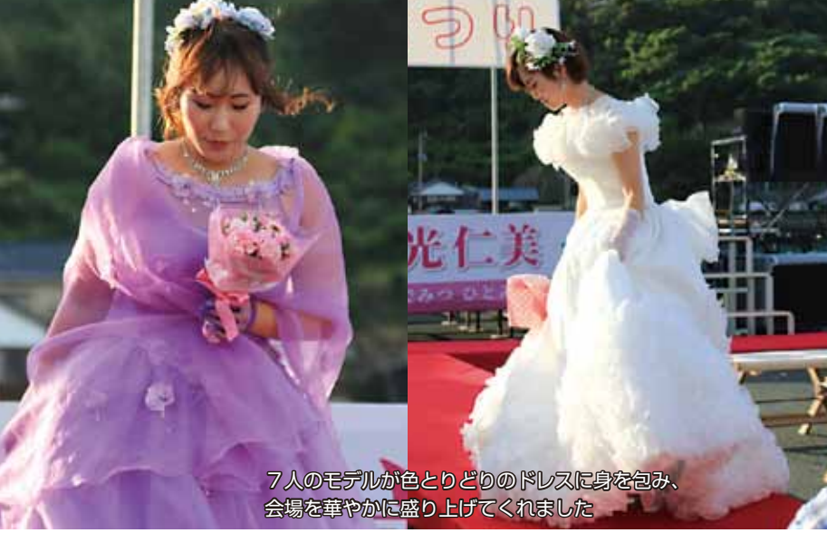
7人のモデルが色とりどりのドレスに身を包み、会場を華やかに盛り上げてくれました