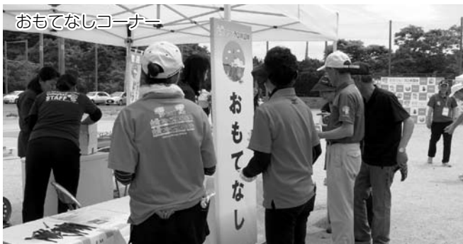
おもてなしコーナー