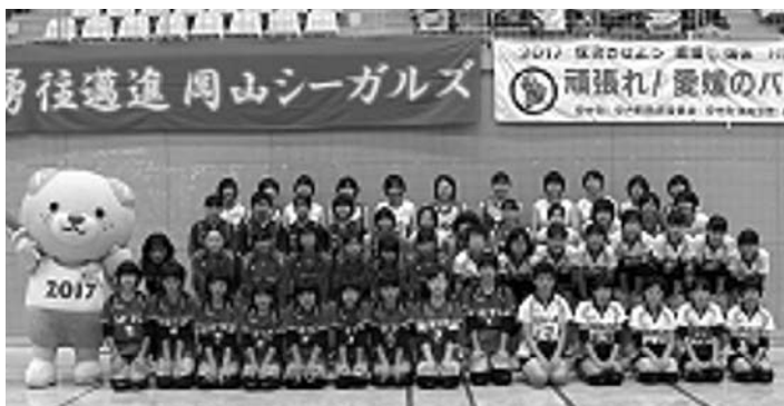
昨年のバレーボール教室から(開会式後に記念撮影)

※ バレーボール教室への参加を希望される方は、教育委員会事務局 生涯学習室(38-2661)までご連絡ください。