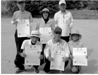
【優勝・準優勝した伊方みなとチームのみなさん】