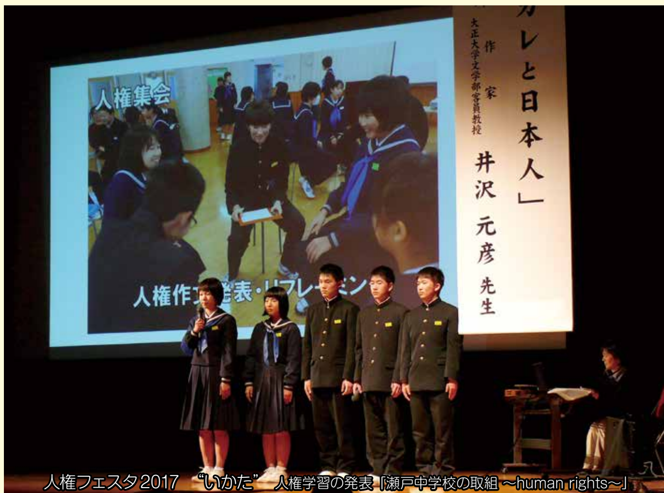
人権フェスタ2017 “いかた” 人権学習の発表「瀬戸中学校の取組 ~human rights~」