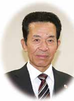
伊方町教育委員会 教育長