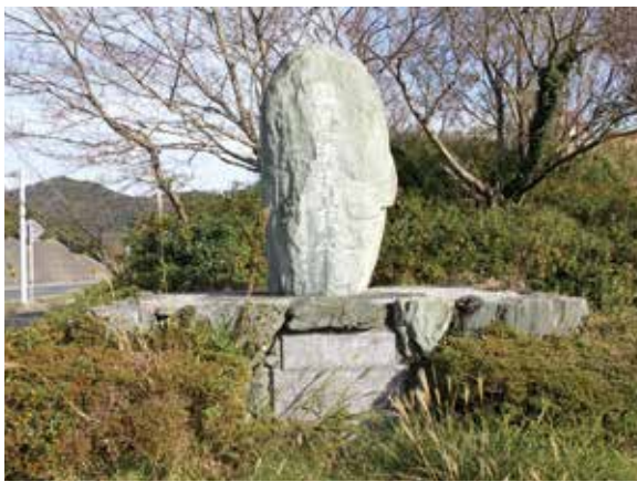
国道改築記念碑 (三机)