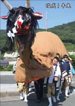
塩成 | 牛鬼