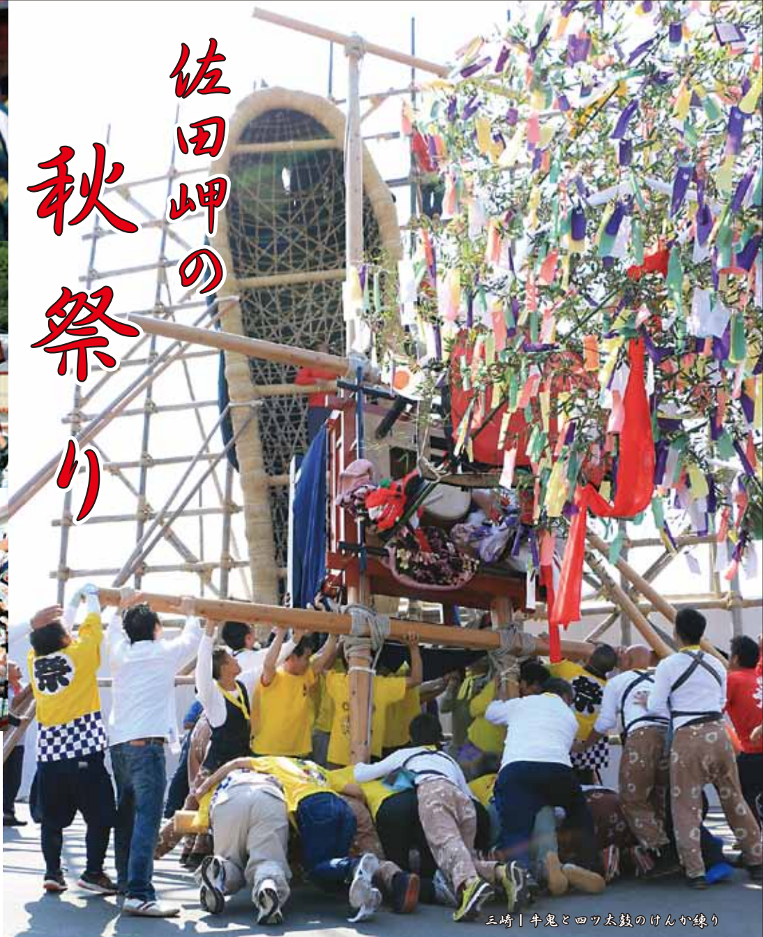
三崎 | 牛鬼と四ツ太鼓のけんか練り

毎年10月8日・9日に行われる三崎地区の秋祭り。フェリー乗り場付近で、9日お昼過ぎから牛鬼、四ツ太鼓のけんか練りが始まりました。住民や観光客が見守る中、今年の勝負は3回行われ四ツ太鼓が3勝する結果となりました。暑い日差しの下、相撲甚句や五ツ鹿など多彩な練りが奉納されました。