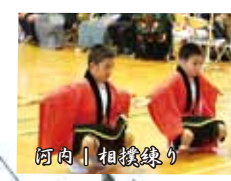
阿内 | 相撲練り