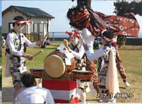
大久 | 唐獅子