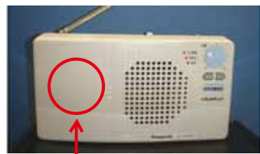
○の部分を押しながら、ふたを左へずらして外します。

災害等によつて停電になつた場合でも、自動的に電池へ切り替わり、受信が可能となりますので、有事の際に備えて早めの電池交換（1年に1回程）をお願いいたします。