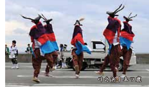
川之浜 | 五ツ鹿