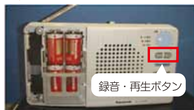
電池は単2または単3どちらでも使用できます。

◆雑音がしていませんか？ 「コンセント」に差し替えても「ピーピー」という警告音や雑音が出る場合は、電池の消耗が原因である場合が考えられますので、電池交換をお願いします。