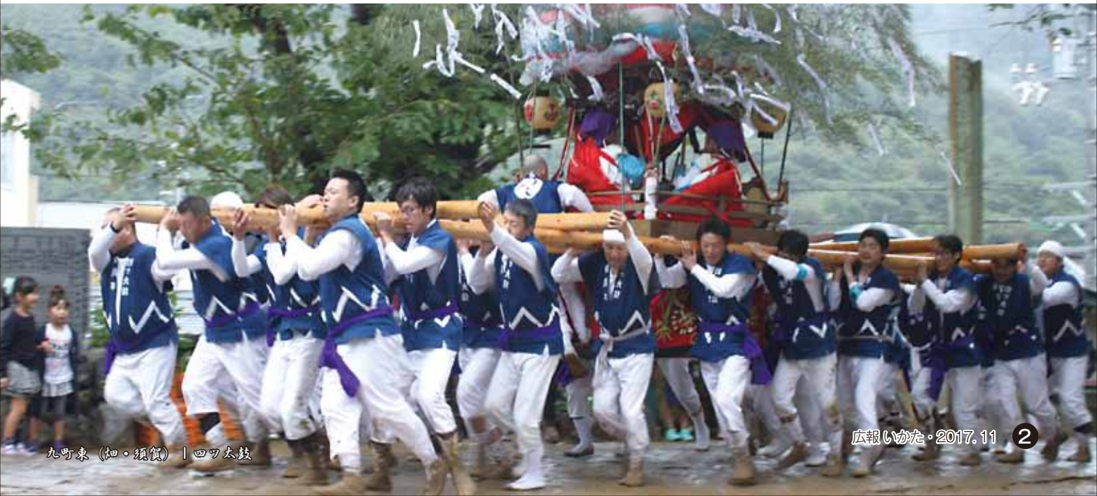
丸町東 (細・須賀) | 四ツ太鼓

毎年10月8日・9日に行われる三崎地区の秋祭り。フェリー乗り場付近で、9日お昼過ぎから牛鬼、四ツ太鼓のけんか練りが始まりました。住民や観光客が見守る中、今年の勝負は3回行われ四ツ太鼓が3勝する結果となりました。暑い日差しの下、相撲甚句や五ツ鹿など多彩な練りが奉納されました。