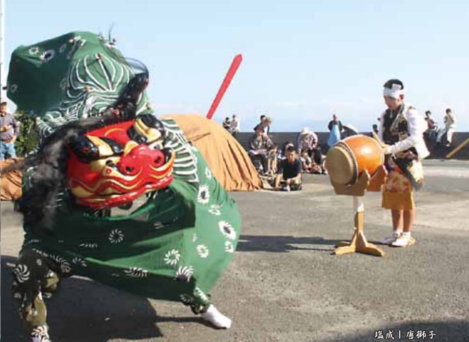
塩成 | 唐獅子