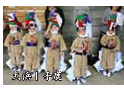
大浜 | 子鹿