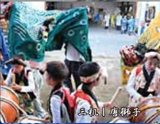
三机 | 唐獅子