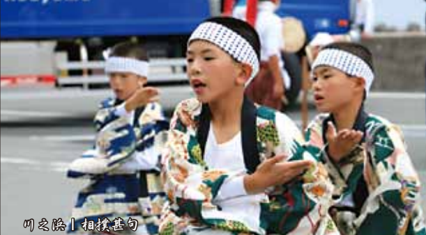
川之浜 | 相撲甚句