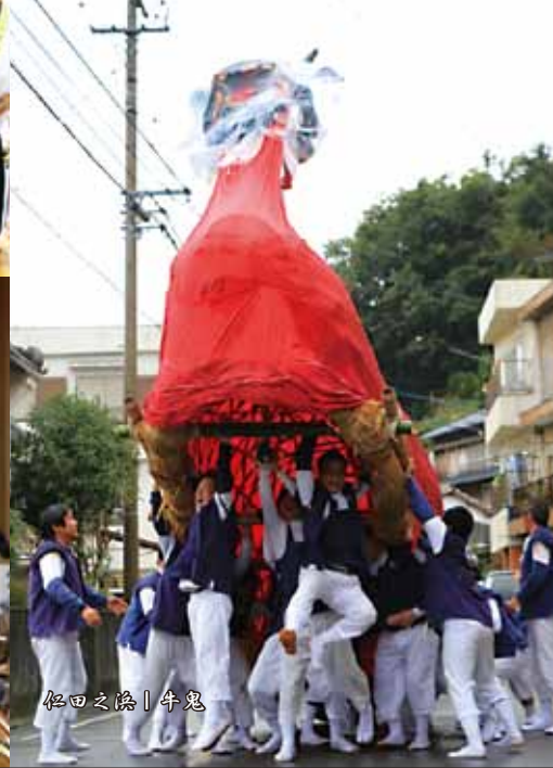
仁田之浜 | 牛鬼