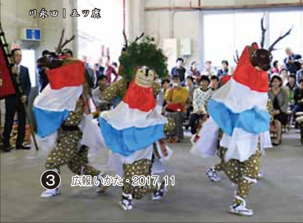
川東 | 五ツ鹿