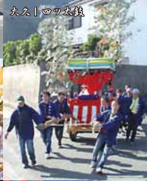
大久 | 四ツ太鼓