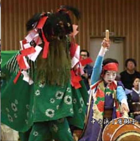
中之浜 | 唐獅子