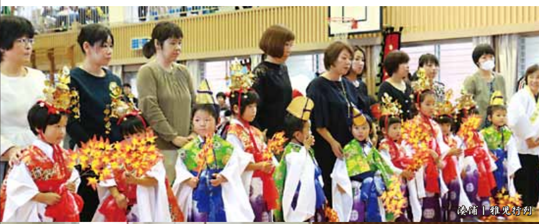
湊浦 | 稚児行列