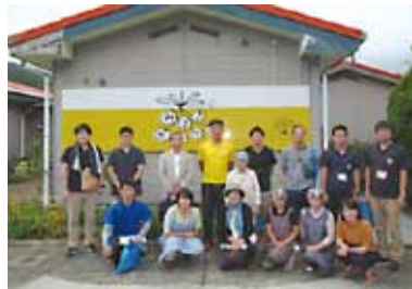
宇和島市「みまきガーデン」で参加者みんなで記念撮影。