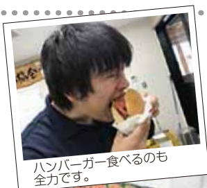
ハンバーガー食べるのも全力です。