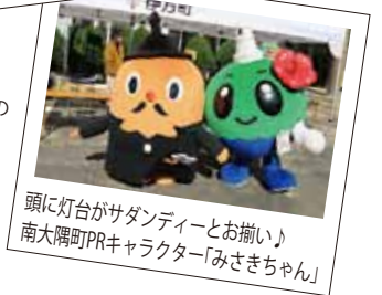
「佐多岬」と「佐田岬」。よく似た名称の2つの岬の初交流となりました。