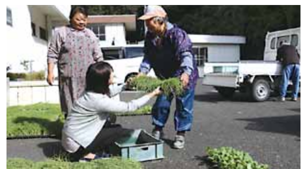
瀬戸支所前で職員が玉ねぎやキャベツの苗を手渡す

本庁や各支所において、高齢者の生きがいづくり事業として秋野菜の苗や種の配付を行いました。この事業は、野菜作りを通して高齢者の健康づくりや地域交流を図ることを目的に、老人クラブを通して希望者に野菜の種苗を配付するもので、年に3回実施しています。玉ねぎとキャベツの苗約98,200本、大根とホウレンソウの種165袋が、町内40グループの方に職員から手渡されました。