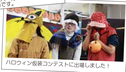
ハロウィン衣装コンテストに出場しました！