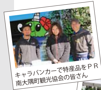
キャラバンカーで特産品をPR 南大隅町観光協会の皆さん