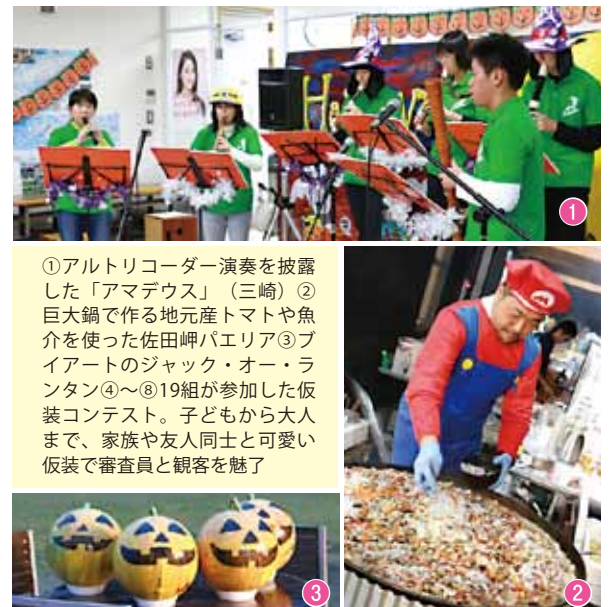
①アルトリコーダー演奏を披露した「アマデウス」(三崎)②巨大鍋で作る地元産トマトや魚介を使った佐田岬パエリア③ブイアートのジャック・オー・ランタン④～⑧19組が参加した仮装コンテスト。子どもから大人まで、家族や友人同士と可愛い仮装で審査員と観客を魅了

イベントでは、アカモクを使ったピザやはなはな焼き、佐田岬の特産品をふんだんに使った佐田岬パエリアなどが屋台で販売された他、ミニコンサートや仮装コンテスト、ジャックオーランジ作り無料体験、ハロウィンメイク無料体験など多彩な催しが行われ、来場者は家族や友人と楽しいひと時を過ごしていました。