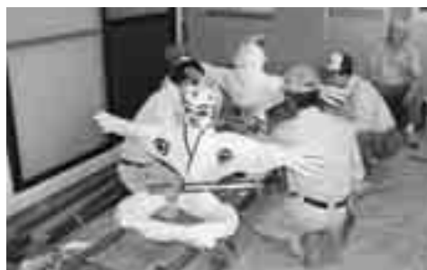
実盛様 (九町2010年撮影)