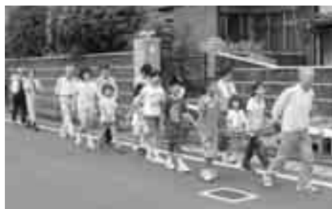
虫送り (九町西2011年撮影)

ていて、今後のさらなる調査が必要です。そうした意味でも、今なお続くこの行事は大変貴重といえるでしょう。 伝承の灯を守り続ける地元の人々に敬意を表し、今後の力強い継承にも期待したいですね。