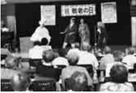
大久地区敬老会(9/17開催)の様子

大大中五増濱山田林阿中木伊上酒山山谷山山山 内西江島田田内中田部部上本井本上上上上上 一博利喜義善太正誠善健清平新一郎芳茂萬博基 幸三雄長淳男助則一信一光一歌松徳良哲基小 春綾スミ子千代子子子子子子子子子子子子子子 美子子子子子子子子子子子子子子子子子子子子