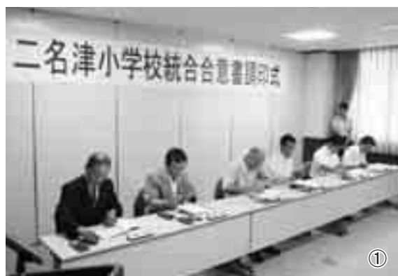
①調印式での署名・捺印の様子