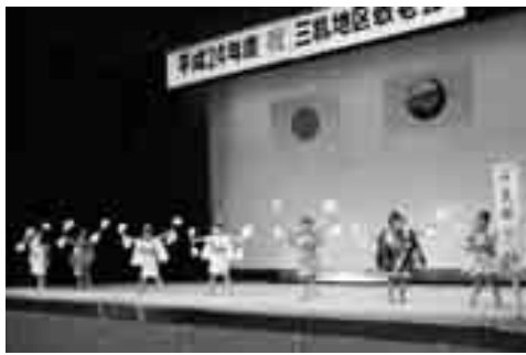
三机地区敬老会(9/15開催)の様子

小門三山山上山阿川井高坂佐瀬古古根須大畑 西田崎本田田西部本上月本々田田田來中橋山 市忠司恭子勝義ツク伊勢雄ミネ子壽千沙子 郎成子子子子子子子子子子子子子子子子子子 子子子子子子子子子子子子子子子子子子子子