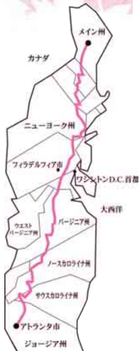
アパラチア・トレイル 総延長3,498km (中央の色がついた太線)