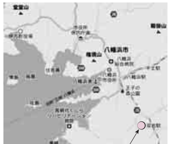
八幡浜市南環境センター