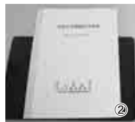
②統合合意書には統合時期や統合先などが記載されている