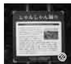
②平成23年度に設置された説明の看板