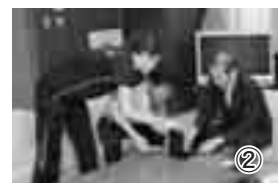
②銅メダルを山下町長に披露