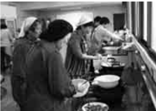
鱈に片栗粉をまぶし揚げましょう。