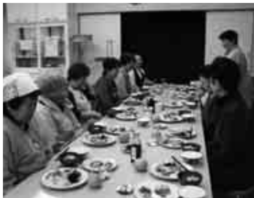
みんなで試食会。「いただきます。」

えていただいたとあって、とても充実していたようです。今年も、色々なことに挑戦していきましょう。