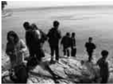
トンネルを越えたら一面の海

子どもたちは普段あまりすることのない山歩きを楽しんでいました。険しかった道のりの最後に、葦で出来たトンネルがありました。子どもたちは、「これを「トトロのトンネル」とはしゃいでいました。そのトンネルを抜けると、視界一面に青い海が広がりました。「わー神秘的」と二人の子が声を上げました。目的地のウマノセの海岸です。苦労して山道を越えた末に広がった宇和海の美しい景色にほぼ感動したのでしよう。 目的地に到着すると、浜辺で弁当やおやつを食べたり、磯遊びや岩登りをしたりと思っても思い通りに興じていました。 浜遊びになごりが尽きない様子の子もたちでしたが、来た険しい道のりをまた逆戻り。皆さん本当にお疲れ様でした。また、地域の美化に貢献いただきありがとうございます。