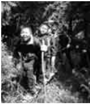
レールを歩く子どもたち