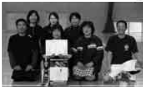
優勝チーム「りりーず」のみなさん