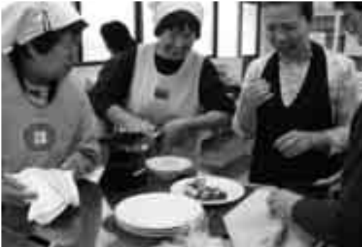
菜の花を巻く春景色に挑戦

女性講座のみなさんは、普段メンバーの誰かが講師をすることが多いのですが、今回は、プロの講師を雇って韓国料理などいつもと少し違った料理に挑戦してみました。普段あまり目にしない料理を教