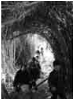
葦で出来たトトロのトンネル

コースは、三崎公民館二名津分館を出発し、二名津の新的お四国巡りのコースである金毘羅山を経由し、サーフィンマニアがよく訪れる名取のウマノセの浜を目指しました。今年は道路だけでなく、急な山道を登ったり下ったりしました。滑って転んだり、栗を見つけたら、レールを歩いたりして、