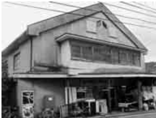
旧大劇(湊浦:2007年撮影)

TEL・FAX 39-0241 (不在の場合)39-2661 生涯学習課 開館時間 9:30~16:30 休館 月曜日ほか