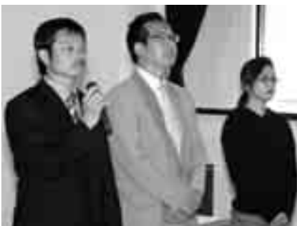
左から、木嶋会長、菊池・川畑副会長

5月12日、瀬戸町民センターにおいて平成22年度伊方町PTA連合会総会が開催されました。9つの小学校、3つの中学校と三崎高校から各学校のPTA会長・副会長、学校長、事務局長が集まりました。