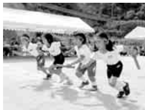
小中学校地区対抗リレー