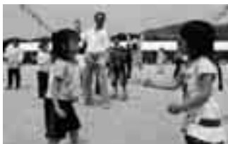
みんなでジャンケン・ポン