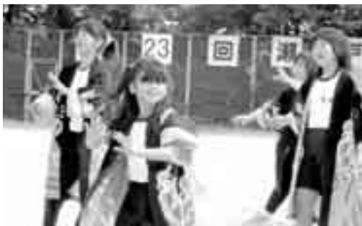
「浜ソーラン」の踊りでオープニング