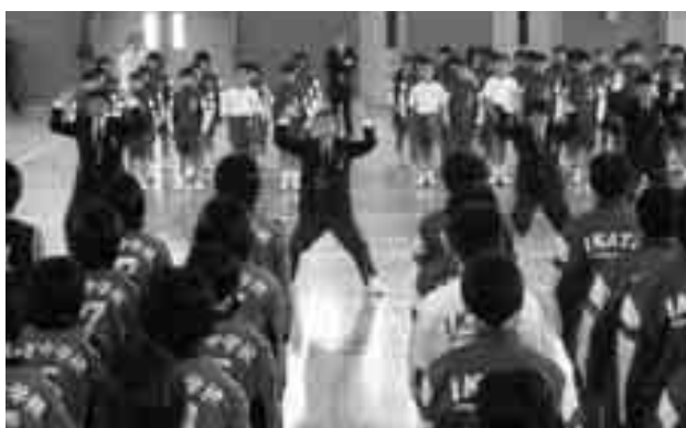
今こそ団結の時（八西総体壮行会）

の十の委員会があり、全校生徒がいずれかの委員会に所属し活動しています。毎月の生徒協議会や各委員会で十分に話し合いを行い日々の活動につなげています。あいさつ活動、アルミ缶回収活動、人権劇の制作、各種集会の企画運営など工夫を凝らしながら活動を行っています。本年度は、地域の美化活動などのボランティア活動にも力を入れていきたいと考えています。いつも笑顔があふれ、生徒の心が互いにつながり合うことで団結し、みんなで前へ進んでいける。そのような伊方中学校を目指していきたいと思えます。地域の皆様の温かいご支援・ご協力をよろしくお願いたします。