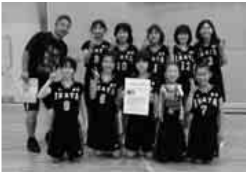
Bブロックで優勝した伊方小学校