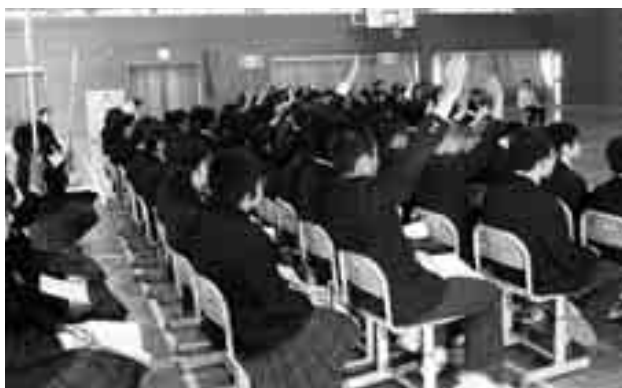
自分の意見を積極的に（生徒総会）

生徒会活動は、各教科の学習や部活動と並び、中学校生活における大きな三本柱の一つです。学校生活における自治的な活動を通し、自主性や豊かな社会性を育てることを目的としています。本校の生徒会活動は、生徒会本部の基、学級、学習、人権、体育、図書、保健、環境、情報、給食、JRC