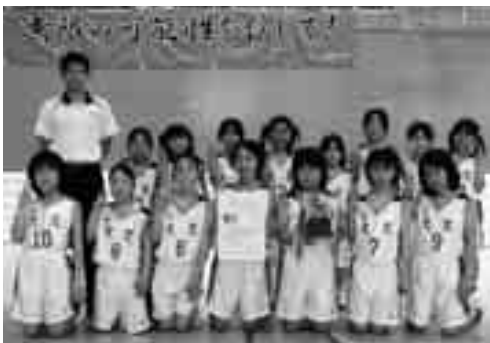
Aブロックで優勝した大久小学校