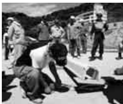
倒壊家屋からの救出訓練