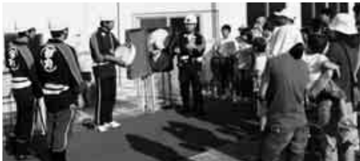
湊浦地区での消火栓の取り扱い講習

当日の訓練は、地域での訓練（第1部）と伊方町民グラウンドでの訓練（第2部）の2つの訓練が実施されました。