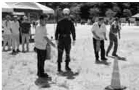
消火器での消火訓練