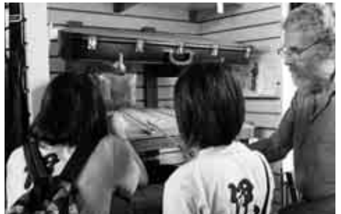
ハンマー・ダルシマーを弾いてみました。

レッドウィング市の見学で一番印象に残ったのは、二つあります。一つは、「ハブガブリン・ミュージック」という、フォーク音楽の楽器屋です。そこで、派遣生たちが日本では見られない「ハンマー・ダルシマー」という楽器を弾いてみる事ができて、その美しい音色を聴くことができました。