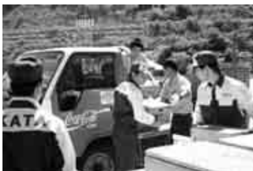
飲料水の提供要請