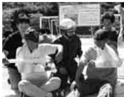
三角巾での応急手当