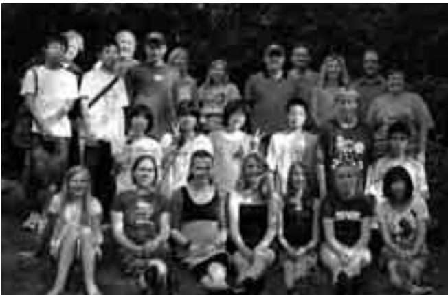
ある日のバーベキューで、伊方町の派遣生がホストファミリーと友達と一緒に記念写真を撮りました。

あっという間に時間が過ぎて、帰る時間になりました。8月13日に伊方町に帰って、それぞれ家に帰りました。おそらく、みんなが涙を流すほど喜んだでしょう。懐かしい日本茶！自分の部屋！おいしいご飯！見た目では、2週間前の自分と変わらないかもしれませんが、一人一人の中には宝物があります。外国に行って、新しい家族に入って、友達や一生忘れない思い出を作って、その「外国」が少し身近になったわけです。そして、ほかの日本人が当たり前だと考えている生活や文化を、短期間だけでも、大切に思えるようになったのです。貴重な海外体験と一緒に過ごさせていただき、ありがとうございました。