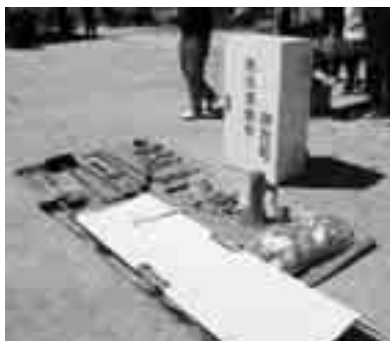
防災資機材の確認

当町では近い将来、南海地震が発生する可能性が高いとされており、強い日差しが照りつける中、参加された皆さんは、熱心に、訓練に取り組んでおられました。