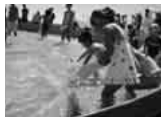
そこの魚！待てえ～い！