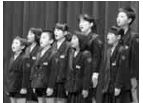
熱唱の二見小児童のみなさん

劇が終了し、最後に演技者と裏方等全員が整列した時には、参加者からおしめない拍手が送られました。