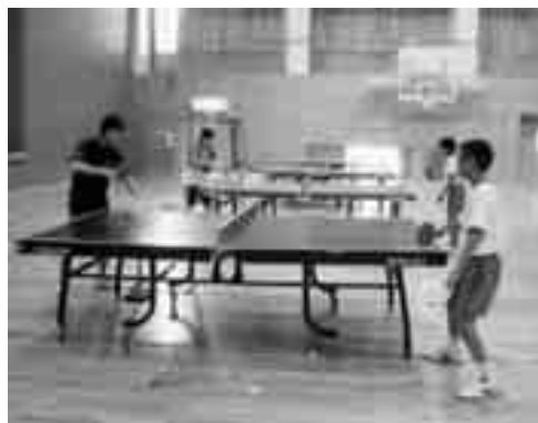
バックハンドの指導

いたりと、試合をしたりと、普段、感じるこことが出来ない貴重な体験をすることが出来ました。 この教室をきっかけに、積極的にスポーツに親しむ向上心が育つことを願っています。