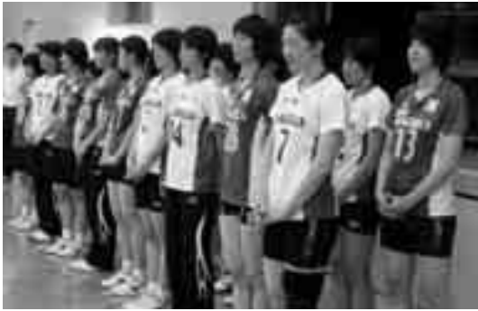
岡山シーガルズのみなさん

7月29日、バレーボールVプレミアリーグ所属チームの「岡山シーガルズ」を招いてバレーボール教室を行いました。この事業は、平成29年に愛媛国体が開催されるにあたり、伊方スポーツセンターがバレーボール(成年女子)会場の内定をいただいているので、地域が一体となってバレーボール競技を盛り上げるために実施したものです。