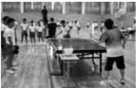
フォアハンドの指導

短い時間でしたが、参加した子ども達は、トップアスリートの講師の方の直接指導して頂