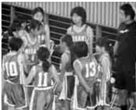
ミニバスケットボールに参加した、三崎チームの試合の様

試合は、35チームによるリンク戦(1チーム2試合)です。選手の皆さんのファイトあふれるプレーに保護者やほかの観客は魅了され、割れんばかりの応援で会場全体が盛り上がっていました。