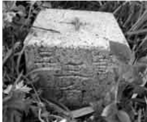
伽藍山の三角点 (2009年撮影)

点が数多く設置されました。この伽藍山の三角点も、その頃に従来あった場所から少し移動して現在地に再設されたのです。二等が三等?の真相はその辺りの経緯と関係ありそうですが今は謎。いずれにしても、重たい標石を担いで険しい山々に登り、三角