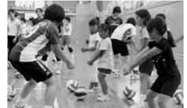
小学生にもわかりやすく説明