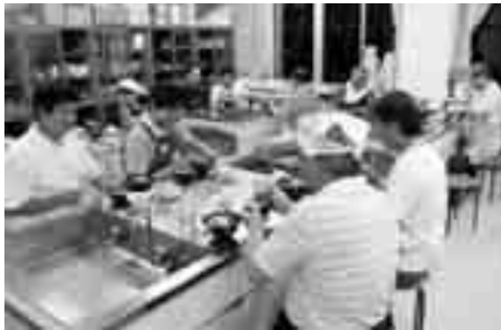
自分たちで作った料理のお味はいかが？