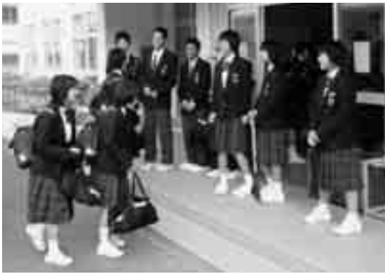
生徒会による毎日のあいさつ活動

「やる気」これは、今生徒たちに一番求められている意欲の部分です。学習への意欲、諸活動への意欲、そして、自りを高めようとする意欲、これらはどれも与えられるものではなく自ら発揮しなければなりません。根気「これは、何事も継続することは難しいことですが、何かを続けることにより、その「努力の貯金」が想像以上の成果を生み出します。「元気」これは、単に「元氣を出せ」