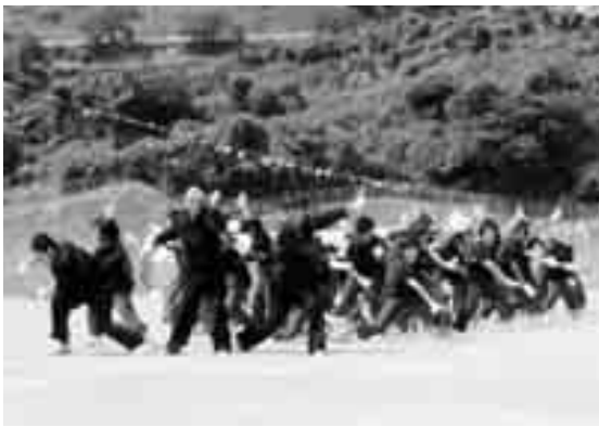
「やる気・根気・元気」の運動会

と言っているのではなく、やる気を出して根気よく努力しているその先にあるものを表現しています。「他人を思いやる優しい心」と「たくましく活動する丈夫な心身」を持ち、「新しいものを求める豊かな創造性」を備えた生徒が活動している姿を想像すると「生き生き、はつらつ」とした生徒の姿があると思います。これこそが目的とする「元気(な姿)」であり、本校の目指す生徒像です。年度当初から、生徒、教職員ともに、この「やる気・根気・元気」の合い言葉を胸に、毎日の学習や委員会活動、部活動、各種行事に全力で取り組んでいます。今後とも伊中生の活動に、ご支援・ご協力をよろしくお願いいたします