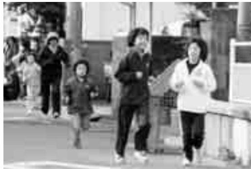
ゴールまであとちょっと