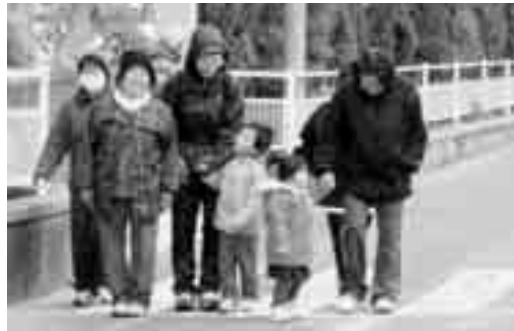
ウォーキングの参加者