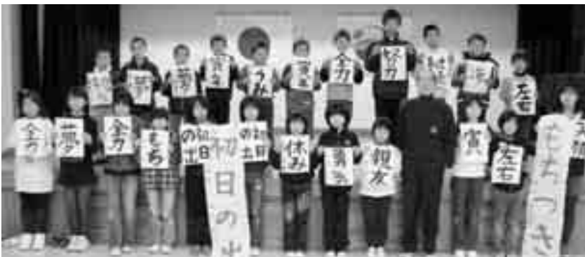
みんなで記念撮影

いました。そして最後に真っ白な半紙と 黒い硯に向い心を落ち着かせ、思い思い の文字を清書していました。 この作品は、1月18日から29日まで三 崎公民館1階ロビーに展示しますのべ、 是非ご覧ください。