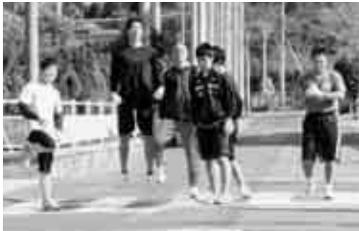
号砲を待つ10kmの参加者

正月に走り初め歩き初めを行い、新年をお祝いしようと、三崎公民館は新春恒例の健康マラソン・ウォーキング大会を1月3日に開催いたしました。 今年で31回を迎えた本大会に、下は2歳のお子さんから上は78歳の方まで118人が参加しました。コースは三崎公民館前をスタートし、三崎地域の南部地区を折り返し戻ってきます。マラソンは初心者用の1.5kmから少し元気な中級者用の3kmと5km、そして上級者用の10kmの4コースを、ウォーキングは5kmの1コースを用意しました。参加者の皆さんは、受付で体力に合わせ思い思いにコースを選擇。スターターの号砲に合わ