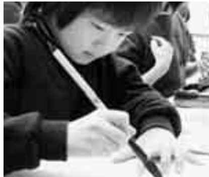
し〜！ 気を散らさないで

いました。そして最後に真っ白な半紙と 黒い硯に向い心を落ち着かせ、思い思い の文字を清書していました。 この作品は、1月18日から29日まで三 崎公民館1階ロビーに展示しますのべ、 是非ご覧ください。