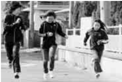
元気にラストスパート