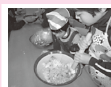
地元食材の夕食作り