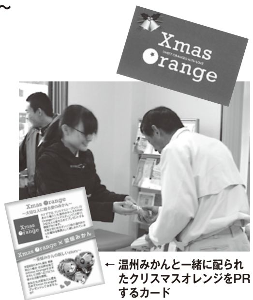
←温州みかんと一緒に配られたクリスマスオレンジをPRするカード

カナダでは、太陽を思わせるオレンジ色の温州みかんは「聖なる果実」として親しまれ、クリスマスシーズンには、日本から輸入した温州みかんなどを「クリスマスオレンジ」と呼び、大切な人に愛を込めてプレゼントするそうです。