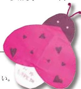
バレンタインカード