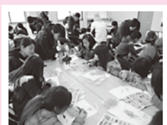
しらすモンスター探し

協会においても、今後、様々な体験メニューを通して、町外の方と町民が交流し、親睦を深めることを目標に活動していきたいと思っておりますので、ご協力のほど、よろしくお願いいたします。