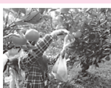
旬の柑橘収穫体験