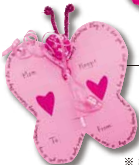
ロリポップグラム