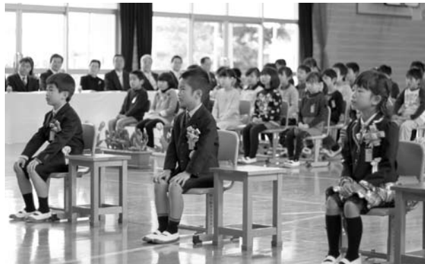
入学式で緊張した面持ちの新入生