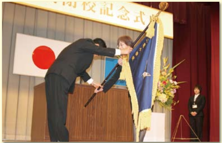
山口教育委員長に校旗を返還する泉校長