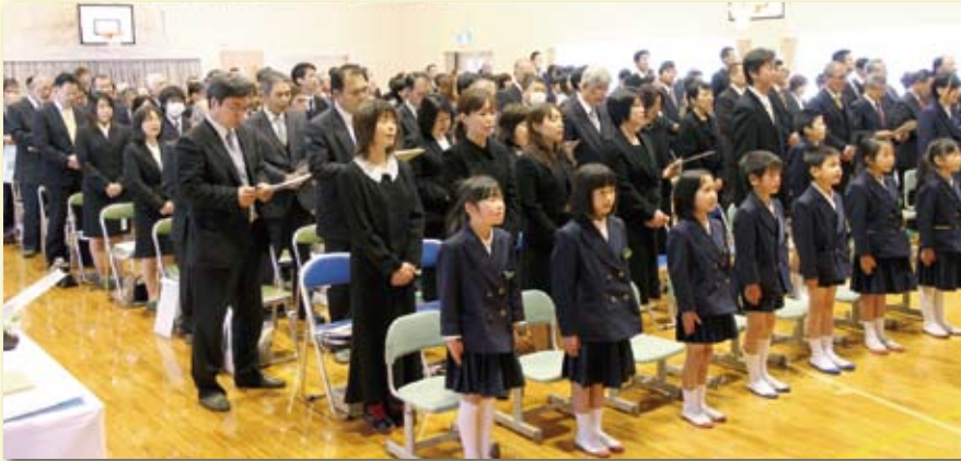
二見小学校への思いを込めて、参加者全員で校歌を斉唱