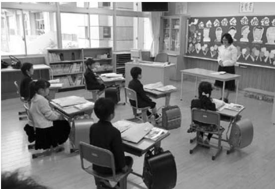
はじめての教室で先生のお話を聞く新入生