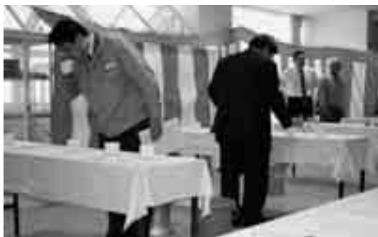
「きき酒コンクール」