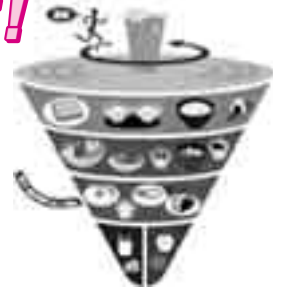
食事バランスガイド

このため、食に関する知識と食を選ぶ力を身につけるための「食育」を推進することを目的として、平成17年7月に食育基本法が施行されました。平成18年3月には、この法律に基づき、食育推進基本計画が決定されました。国では、国民運動として食育を推進していくために、毎年6月を「食育月間」、毎月19日を「食育の日」と定めています。最も身近で大切な「食育」をみんなで進めましょう!