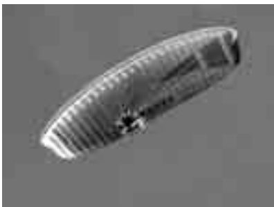
モーターパラグライダーでの撮影