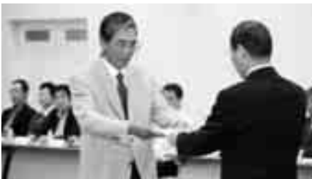
委嘱状を受け取る大山区長さん

今後、各地区と行政とのパイプ役として各区長のみなさん1年間よろしくお願ひします。 なお、今年度区長・常会長のみなさんは下記のとおりです。