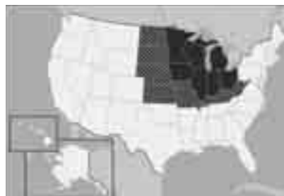
アメリカの北中部

たとえばニューヨークやロサンゼルスなどはほとんど西海岸か東海岸のどちらかにあります。そんなシックでモダンでダイナミックな両岸に挟まれているのが、味気ない、退屈な、地平線までつづく畑だらけの田舎だ、というイメージが昔からアメリカ全国に広まっています。