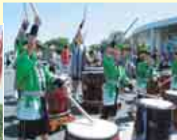
伊方堂々太鼓ジュニアの演奏