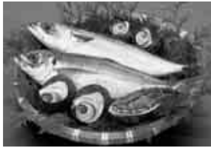
海の幸(岬アジ、岬サバ)