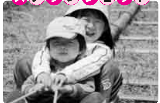
もぉ〜モォ〜フェスティバル 仲良く草すべり