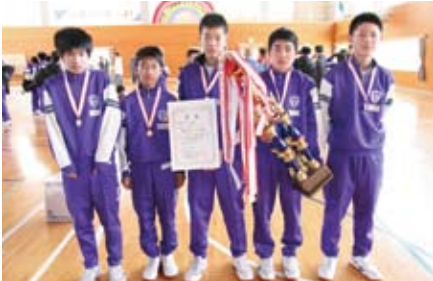
2部男子優勝 伊方中バスケット部