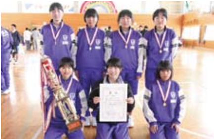
2部女子優勝 伊方中バスケット部A

1部は地域単位のチームで年齢別10名、2部は小学校5年生以上の愛好者チームで男性は5名、女性7名で構成、田之浦集会所横をスタートし、大浜で折り返し伊方中学校をゴールとする18.64kmのコースで行われています。