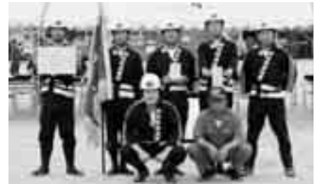
小型ポンプの部優勝 第8分団