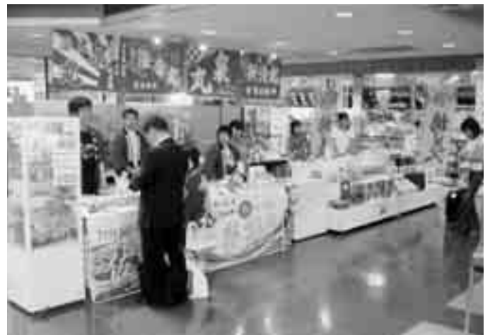
大漁旗が目目を引く賑やかなイベント会場。販売参加者の説明に耳を傾ける空港利用客。

また、地元の三崎高校生も職業人アビリティ育成事業の一環としてイベントに参加し、売り場で元気ががんばりました！