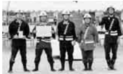
小型ポンプの部2位 第1分団