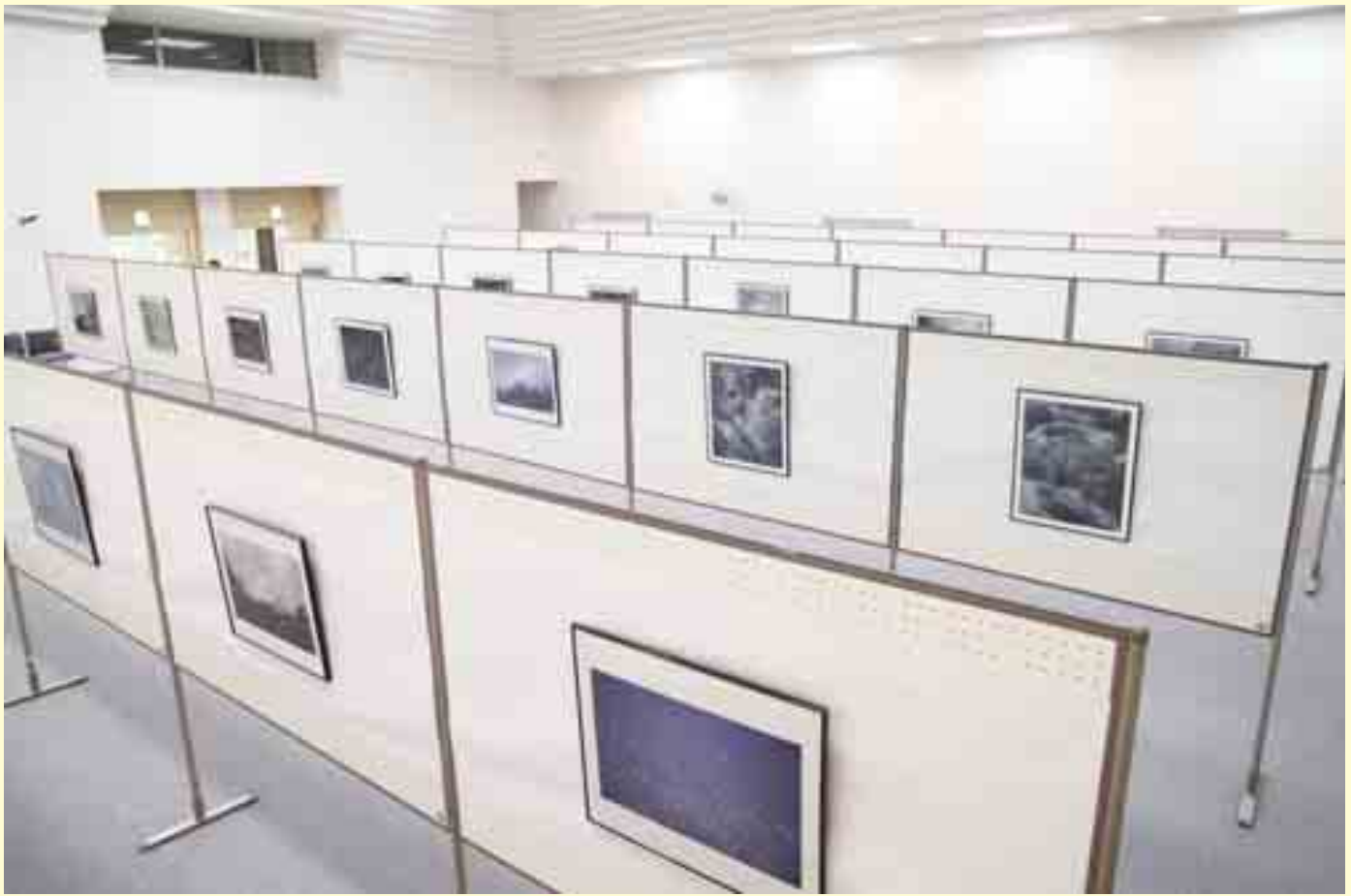
世界各地で撮影された70点余りの水の写真