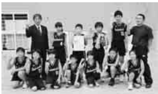
見事連覇 優勝 佐田岬小学校

6月6日(木)、伊方スポーツセンターにおいて西宇和郡小学校バスケットボール大会が開催され、町内の小学校が参加し、熱戦が繰り広げられました。 参加した8つのチームを2つのブロックに分け、それぞれのブロック上位2チームが決勝戦を行う方法で行われ、 決勝はAブロック1位の伊方小とBブロック2位の佐田岬小、そして、