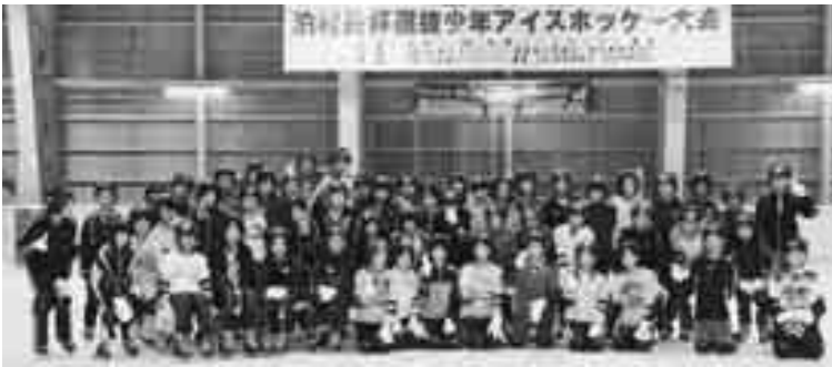
泊村児童とアイススケートで交流

町村縁組を締結した翌年の平 成11年から継続して実施して いる事業です。これまで38 0名の児童がこの事業で北海 道を訪れています。 3泊4日の研修を通して、 子ども達は初めての経験が沢 山あったと思います。この体 験を生かして、今後の人生に 役立ててもらいたいです。