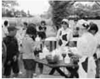
アイスクリーム作り

町村縁組を締結した翌年の平 成11年から継続して実施して いる事業です。これまで38 0名の児童がこの事業で北海 道を訪れています。 3泊4日の研修を通して、 子ども達は初めての経験が沢 山あったと思います。この体 験を生かして、今後の人生に 役立ててもらいたいです。