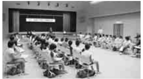
泊村公民館で歓迎式(伊方児童40名と泊児童17名)