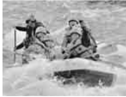
一番人気のラフティング体験