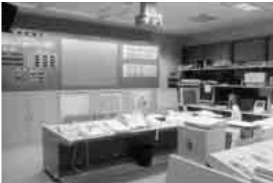
通信指令室（改修中のため現在の指令室写真）

八西地区全ての119番を受信し、災害規模に応じ部隊を出動させ、無線統制を行う。（デジタル無線対応）