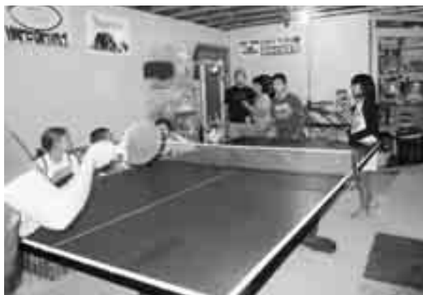
地下室で卓球をして遊びました。

他にもたくさんありましたが、これからどんどん伊方町のライフスタイルに溶け込んでほしいですね。