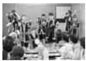
伊方堂々太鼓ジュニアが 元気な太鼓で皆さんを お祝いしました