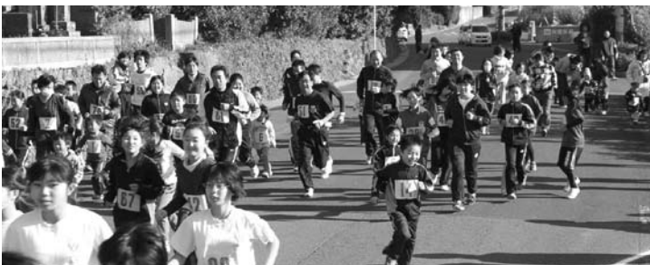
168名のランナーが一斉にスタート