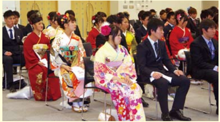
厳粛に行われた式典