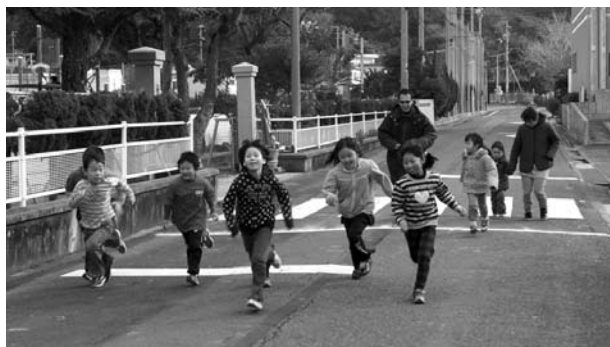
マラソン1.5kmのスタート