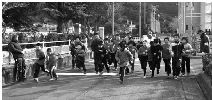
マラソン3.0kmのスタート