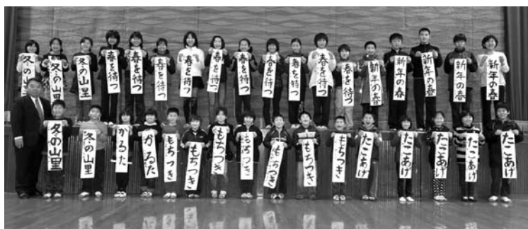
四ツ浜地区体育館会場