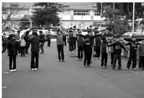
参加者全員で準備運動

また、ウォーキング5.0kmの部門では、日頃の運動仲間と共に軽やかな足取りで新春の峠路を楽しみました。