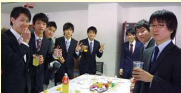
大賑わいの茶話会