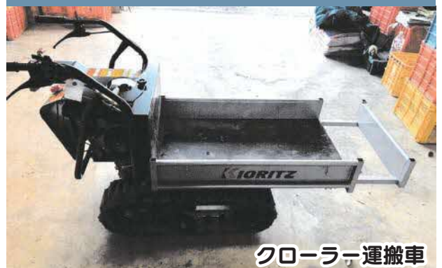
クローラー運搬車