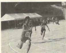
男子400mリレースタート