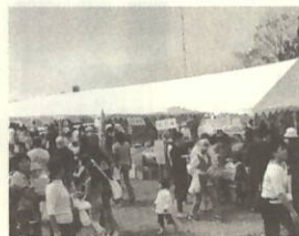
出店が立ち並びまつり会場

公園一体に響きわたる太鼓の音色でまつり開幕。昨年に続き「回目」となった「風車まつり」が十月三日(日)行われ、小さな子どもも手を引いた家族連れが大勢訪れ、賑わいました。