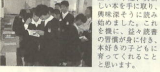
児童らは早速、真新しい本を手に取り、興味深そうに読み始めました。

今年15日、講談社等から関係者が大久小学校を訪れ、贈呈式が行われました。寄贈式終了後、児童らは早速、真新しい本を手に取り、興味深そうに読み始めました。これを読書の習慣が身に付き、本好きの子どもに育ってほしいと思います。