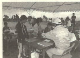
理想の公園を考える子どもたち