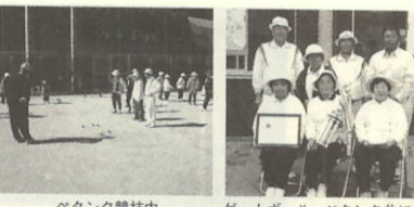
ゲートボール、ベタング共に優勝、神崎Aチーム