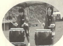
「風ジュニア」の太鼓でオープニング