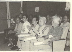
米寿の皆さん 金婚式を迎えた皆さん