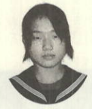
作品名 絵画「すわっている人」

手や足をちゃんとかきました。かいたところもかきました。全部がかけるようにしました。バランスよくかけたからよかったです。