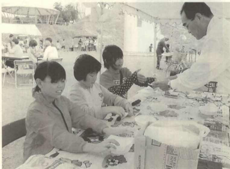
「レモンから電気を起こす!!」楽しく実験中の子どもたち