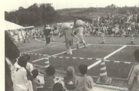
大人気の「アンパンマンショー」

また、風の体験広場では、子ども達に身近な体験を通して、環境に優しい自然エネルギーについて教えてもらおうと、「風」をテーマにした実験や工作コーナーが設けられ、風ぐるまや竹トンぼ作り、果物などを使って電気を起こすなど様々な実験が行なわれました。どのコーナーも子ども達の興味や好奇心をそそぎ、熱心に工作や実験に取り組みていました。二回行われた「それいけ!アンパンマンショー」は、小さな子ども達に大人気で、町内外から訪れたたくさんの方々が会場を埋め尽くし、子ども達の熱気と歌声に包まれていました。