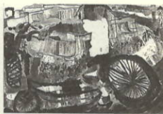
作品名 絵画「ばくの赤い自転車」

自転車で乗って坂を下る様子をえがきました。タイヤをぬることがむずかしかったです。でも、一番しゅうずにできたところです。