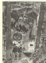
作品名 絵画「ろう下から見た風景」