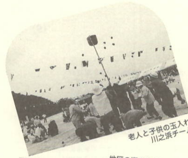
老人と子供の玉入れ 川之浜チーム