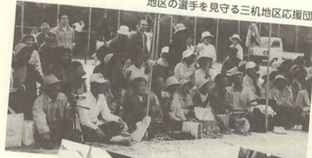
地区の選手を見守る三机地区応援団