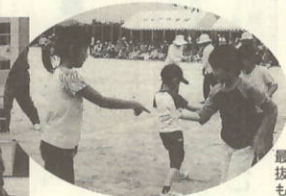
最後まで勝ち抜いてお米をもらおう

新種目「急げよ急げ」 フラフープをくくって全員リレー。 「抜けないッ」(笑) 堀成チーム