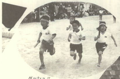
ダッシュ!! 校区対抗リレー

新種目「急げよ急げ」 フラフープをくくって全員リレー。 「抜けないッ」(笑) 堀成チーム