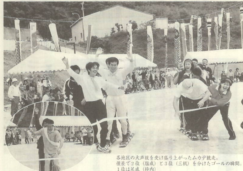
各地区の大声援を受け盛り上がったムカデ競走。 僅差で2位(堀成)と3位(三机)を分けたゴールの瞬間。 1位は足成(神内)