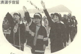
「力いっぱい闘います」 塩成地区代表選手宣誓