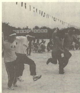
夫婦息ぴったり 「二人の瀬戸町」