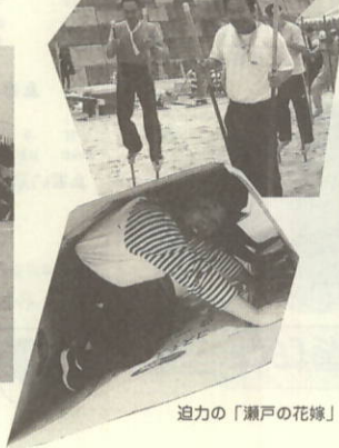
迫力の「瀬戸の花嫁」