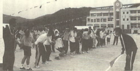
「軽い軽い」余裕の表情 「リーチングホーム」