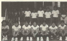
女子バレー部 河内主将談 「毎日、休まず練習してきた成果を全て出し切って一回戦を突破したい!」