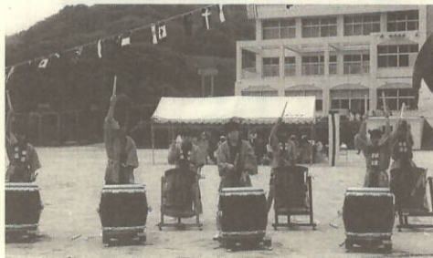
「風 ジュニア」の演奏で開幕

思ひめぐり 「思い出づくり」 五月十八日(日)、心配された雨もなく、絶好の運動会日和に恵まれ、最後となる町民運動会はたくさんの方々が参加して賑やかに行われました。楽しく微笑ましい種目、油力のあるゲーム、思わず応援に力が入った白熱した種目。笑い起こり、歓声が上がり、ため息がもれ、それぞれに思い出深い運動会となったようです。