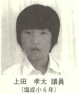
上田 孝太 議員 (塩成小6年)

ングはいつも使えるようにしておき、舞台の使用などに支障がある時だけ上げ下げしてはどうでしょうか。 この点は先生方も相談をして、皆さんが少しでも利用しやすい方法にしたいと思えます。