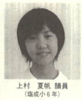
上村 夏帆 議員 (塩成小6年)

▽塩成小学校では水泳授業が始まる七月に海岸掃除をしますが、「ゴミの多さに驚きます。そこで、町で出される大量のゴミの処理方法や費用について教えてください。」