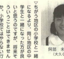
阿部 未来 議員 (大久小6年)

いつもお報を楽しみに読んでもらい、ありがとうございます。さて、広報の制作工程ですが、まず最初に町内の行事や興味深い出来事などについて情報を集め、現場取材を行います。そして取材に基づいて記事を書き、発行の二週間前に印刷会社に原稿を渡します。それから発行までの間に何回も文字の誤りや内容を入念にチェックし、これが大丈夫といった段階で本印刷を行っています。この様に、広報を発行するまでには色々な作業があるので、ほぼ毎日、紙面づくりに取り組んでいる状況です。これからも皆さんに親しまれる広報づくりに頑張りますので、楽しい話題や広報についてのご意見がありましたら企画課までお寄せ下さい。