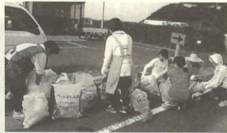
集めたごみを分別する参加者の皆さん

六月二日(土)、町内全域で女性団体協議会が主催する「クリーン作戦」が展開され、女性たちが町内各地区の清掃に汗を流しました。この行事は、女性の手で町を美しくしようと平成九年から始められたもので、今年で五回目。婦人会やPTAのメンバーら約三百名が参加し、早朝から各地区ごとに公園内や幹線道路沿いにポイ捨てされた街やゴミを拾って回り、町内全域で軽トラック七台分の空き缶、空き瓶、ペットボトルなどが集まりました。早朝からさわやかな汗を流した参加者たちは、自分たちの手ですっかりきれいになった町に満足げな様子でした。