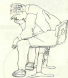
作品名 「かんがえる人」

私が一番工夫した所は、顔のひょうじょうです。こまったひょうじょうにしました。むしろかかった所は、せなかの部分です。