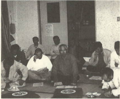
真剣に聞いている大江の皆さん