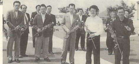
悲報を受け、5月25日(金)「励ます会」メンバーと町関係者が記念碑に献花を行った。