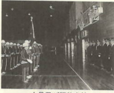
人員及び服装点検