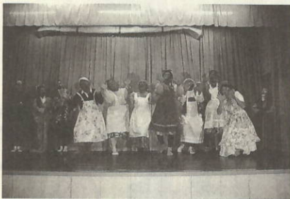
川之浜小学校の学芸会。お父さん方が、慎吾ママに扮して「おはロック」を熱演しました。

二月四日(日)、各小学校で学芸会が行われました。 川之浜小学校でも午前八時三十分の開始前には、孫の出番を楽しみにしていたおじいちゃん、おばあちゃんを始め、日頃はあまり学校を参観しないお父さん方が大勢詰めかけ