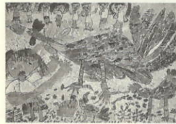
作品名 チャボとあそんだよ

がんばったことは、細かいところをていねいにぬったことです。絵の具を混ぜて、きれいな色でぬりました。