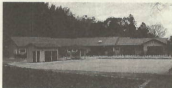
新設されたグループリビング