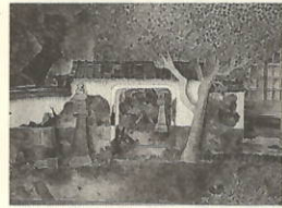
作品名 「お寺の風景」

一番工夫した所は、色の塗り方です。明るさの違いを表すことができました。葉っぱの一枚一枚の色を変えるのが大変でした。