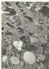
作品名 「大きなかぶをひきぬぞ」

はじめてのうんどう会の思いでえをえにつまにかきました。えをかくのがすこしいへんでした。