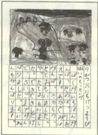
作品名 「たのしかったらうんどうかい」

はじめてのうんどう会の思いでえをえにつまにかきました。えをかくのがすこしいへんでした。