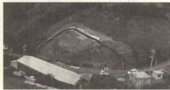
災害復旧工事が予定される町道田部高茂線

四ツ浜漁港海岸保全事業費 ほか一億二千二百万円を追加補正し、予算総額を二億九千八百万円とするもの。 ・小型合併処理浄化槽補助金 二百五十万円 ・大江渡畑水路整備事業 九百万円 ・四ツ浜漁港海岸保全事業 三千百万円 ・大久地区内三号線改良事業 八百万円 ・公共土木施設災害復旧事業 四千万円