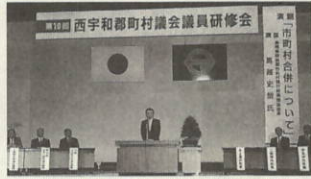
市町村合併をテーマに開かれた部議員研修会

①ごみ処理の広域化 八幡浜市に対し、西宇和郡五町と宇和・明浜の七町が広域処理を要請し、地元関係者の合意を得たと聞く。広域化は、ダイオキシン対策や業務の効率化などを目的に実施されると思うが、次の二点について伺う。 ・これからの作業と実施時期 ・経費負担とその内容