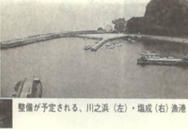
整備が予定される、川之浜(左)・塩成(右)漁港

漁港についても来年度から防波堤の新設改良、船揚場整備などを計画している。特に塩成漁港は立地条件の観点から、宇和海側の避難港としての機能を持つ拠点漁港として整備していく。