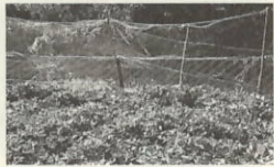
猪の侵入を防ぐために設置された防獣ネット

③急傾斜地対策事業は崩壊の危険性がある箇所(人家五戸以上)について、県が事業主体となり崩壊防止施設を設置する事業で、これに要する用地は無償提供となっている。