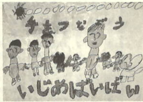
作品名 「手をつなごう」

人や犬やうさぎがみんな手をつないで仲よくしているところです。クレヨンで色をぬったあと絵の具ではじくように工夫しました。