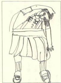
作品名 「クロッキー」