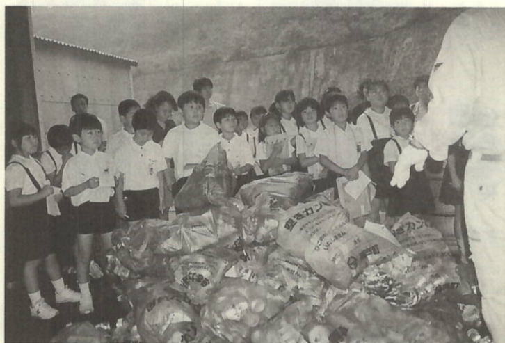
ごみ処理場で空缶の山を目の前に、リサイクルについて説明を受け興味津々の児童たち

新年度がスタートして以来三ヶ月が経過しておりますが各位のご理解によります新年度事業の執行については、「新規町営バスの運行・身の回り行政関連」など住民に身近で、緊急性のある業務対応を積極的に展開しておりますが、住民からも好評の声を頂き、今後においても迅速な対応を心がけ継続してまいりますと考えています。 本年度当初予算の審議でも申し上げたが、「福祉の充実・産業の振興・定住促進」を掲げご理解を頂き事業推進を行っているが、この状況について概要を報告します。特に「福祉の充実」については、平成十二年四月から実施され