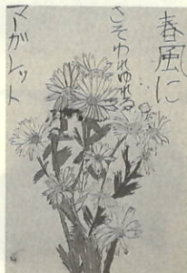
作品名 「マーガレット」

図工の時間、春を見つけようという題で植 物をさがした時目にしたのが、このマーガ レットです。風にゆれる姿がかわいかった です。