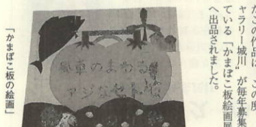
「かまぼこ板の絵画」

デイサービス利用者が、午前中の制作の時間にかまぼこ板による絵画を作成。かまぼこ板に小さな貝殻や、なごの蓋を一枚一枚、丹念に張り付け色を付けるという細かい作業のことで、指先を使ったりハビリ効果も満点!!かまぼこ板を百枚使用し、縦八十四cm×横百五十cmとサイズもビッグな力作です。四月末に完成したこの作品は、この度、「ギヤラー城川」が毎年募集している「かまぼこ板絵画展」へ出品されました。