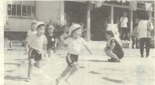
大久保保育園運動会