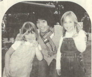
阿部さん(中央)とホストファミリー