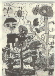
(ぼくの大きなあさがお)