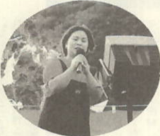
お姉さん上手です

入場者プレゼント抽選会では、伊勢エビ、サザエの詰め合わせ豪華商品が当たるとあつて抽選会場には大勢が詰めかけました。夕方には、物揚場で地元の大鼓グループ瀬戸町太鼓集団「風」と広島県太鼓グループ太鼓本舗「かぶら屋」による和太鼓共演も行われ、熱心に聞き入っていました。夜には、まつりのフィナーレを80発の花火が三机湾を飾りました。