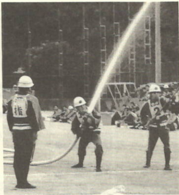
町大会での第1分団小型ポンプ操法