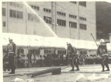
第8分団小型ポンプ操法