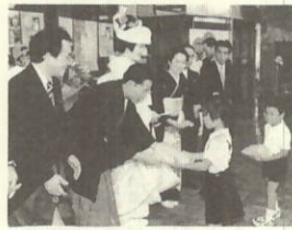
町民センター前 出発セレモニーで

「これからは遷析治療を受けている新郎に力いっぱい水を飲ませてあげたい、早く病気を直してあげたい」と言う新婦の言葉に出席者の胸を打つ。そして両親への花束贈呈が行なわれ、パーティーは終了した。この日をいつまでも忘れずにどうかお幸せになつて下さい。