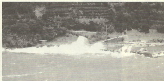
大江漁港 防波堤植波状況