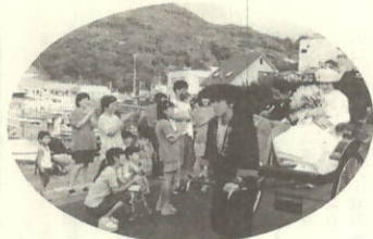
沿道で祝福を受けるお2人

1998年8月1日、私達にとって生涯忘れられない記念日となりました。皆様から頂いた祝福と温いおもてなしを思い出しに帰路の途中、眼下に広がる美しい三机湾に胸が熱くなりました。「また、帰って来よう」彼の言葉どおり瀬戸町は私達の大切なふるさととなりました。この日の気持ちをいつまでも忘れずに、二人手を合わせ頑張っていきたいと思います。瀬戸町の皆様、素晴らしい思い出を有難うございました。