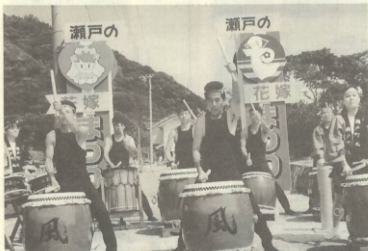
瀬戸町太鼓集団「風」の演奏