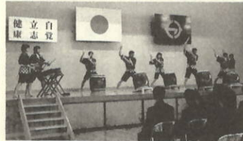
▲勇壮な太鼓の披露