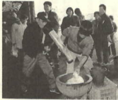
お父さんガンバッテ