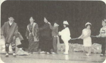
大きなかぶ 三机小学校

2月1日、8日の両日、町内各小学校で学芸会が行われました。この日のために練習を重ねた児童達は、舞台の上で力強い口調と全身を使っての演技を発表し、保護者や地域の方々から盛んに拍手がおくられていました。