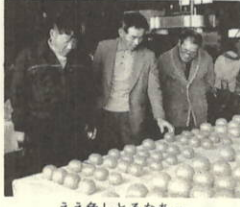
ええ色しとるなあー。

果実品評会コーナーでは各農家の自信作がずらりと展示され、それぞれの出来ばえを熱心に見入っていました。また、女性部による青空市、バザーコーナー。農機具、生活用品の展示即売等多彩な催しが行われ大